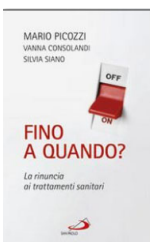
Mario Picozzi "Fino a quando? La rinuncia ai trattamenti sanitari" ed. San Paolo, 2012