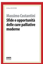
Massimo Costantini “Sfide e opportunità delle cure palliative moderne” Ed. Asmepa, 2017