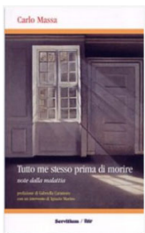
Carlo Massa "Tutto me stesso prima di morire" Ed. Servitum, 2008