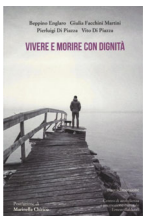
Beppino Englaro, Giulia Facchini “Vivere e morire con dignità” ed. Nuovadimensone, 2016