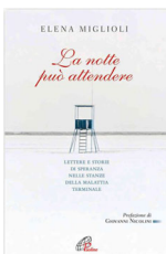
Elena Miglioli "La notte può attendere" Paoline Editoriale Liribi, 2011