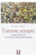
Attilio Stajano "L'amore sempre. Il senso della vita nel racconto dei malati terminali" Ed. Lindau. 2013