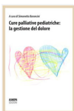
Simonetta Baroncini “Cure palliative pediatriche, la gestione del dolore” Ed. Asmepa, 2016