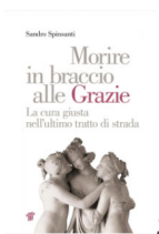
Sandro Spinsanti “Morire in braccio alle Grazie” Ed. Il pensiero Scientifico, 2017