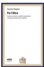
Francesco Campione “Per l’altro” Ed. Asmepa, 2014